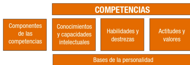
Figura 1. Componentes de las competencias.

El concepto de competencia incluye como se ha mencionado, la adquisición de conocimientos, la ejecución de habilidades y destrezas, el desarrollo de actitudes y valores, que en su conjunto conforman la base de la personalidad (SEP, 2009) de un individuo que se encuentra inmerso en una sociedad. Los componentes se aprecian de manera gráfica en el siguiente esquema elaborado por la Secretaría de Educación Pública, incluido en el material de apoyo del curso de actualización docente antes abordado.