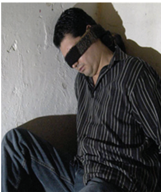
ALGUNOS PAÍSES abordan la victimología desde una perspectiva constitucional, mientras que otros delegan esta responsabilidad a las ONG o a Derechos Humanos.

Otros conceptos que se manejan son: victimidad, victimización, factores victimógenos, en los que, el primero se entiende como el estado físico o corporal de padecer por algún delito o conducta antisocial. La victimización es la acción de ejecutar un acto por el cual una persona se convierte en víctima y por último (más no limitativo), los factores a que se hacen referencia son las condiciones en el ambiente o en el interior de alguien que conducen o favorecen a que sean víctimas; por ejemplo, una casa desprotegida, la oscuridad, el descuido, la elegancia en exceso, la ceguera, la invalidez corporal y la edad, entre otros. que, el primero se entiende como el estado físico o corporal de padecer por algún delito o conducta antisocial. La victimización es la acción de ejecutar un