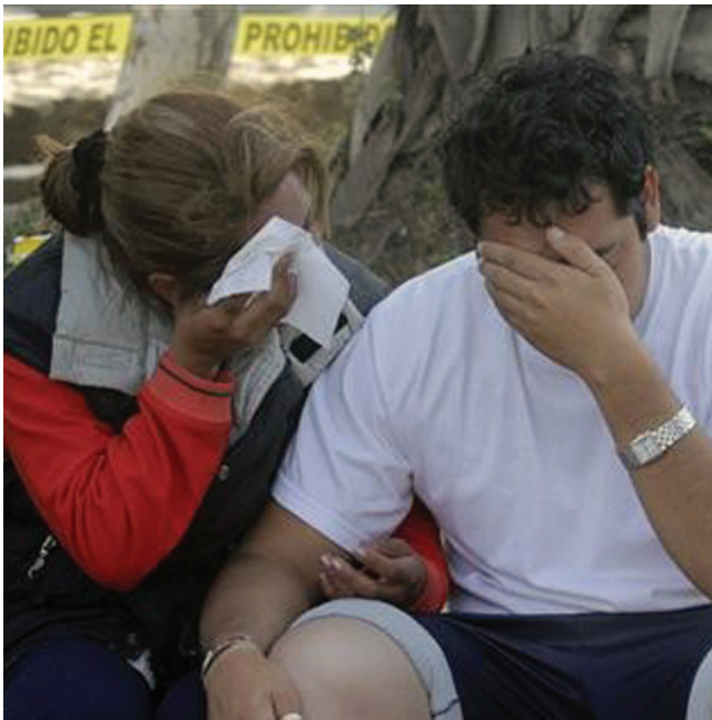
EL ESTUDIO de víctimas también se preocupa por las personas que han sufrido por terrorismo, tráfico de órganos, tráfico de personas, incluso de las que padecen por agresiones de animales.

En 1989 surgieron las “Encuestas de victimización”, herramienta que se ha convertido en obligatoria pero desafortunadamente ha caído en la monotonía