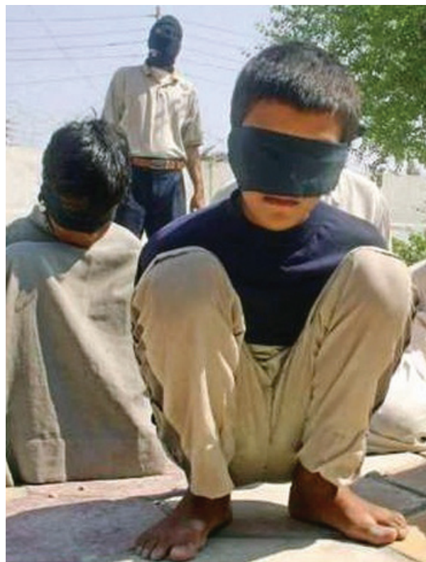
LA VICTIMOLOGÍA estudia con métodos científicos el papel que juegan las víctimas dentro de un crimen y la atención que estas necesitan para reparar el daño sufrido.

De lo anterior se puede desprender que hay varios tipos de victimologías, si al momento actual no se reconocen, quien esto escribe no tiene duda que un futuro próximo exista la especialización victimológica, esperando que la situación no