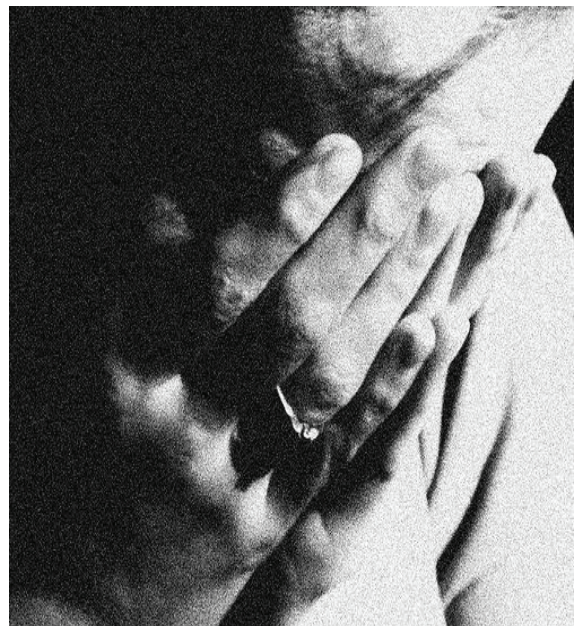
LA CRIMINOLOGÍA moderna busca pasar a un segundo plano en la investigación del delito: podría dirigir su atención científica a las víctimas de los crímenes.

¿Se estará en posibilidad científica, académica, de infraestructura, gubernamental y demás necesario para atender y estudiar a una víctima?