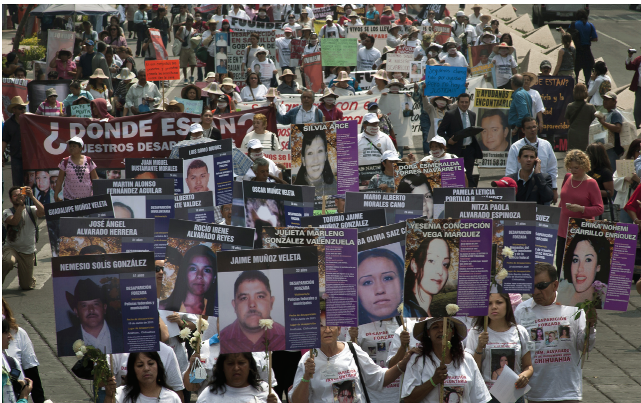
UN EJEMPLO de la desatención a víctimas son los miles de mexicanos que sufren la desaparición de alguno o varios familiares.