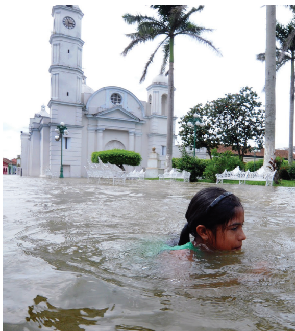
PERSONAS QUE sufren por desastres naturales, como tormentas, inundaciones, terremotos, deslaves, sequías, etc., también necesitan de tratamiento y rehabilitación.