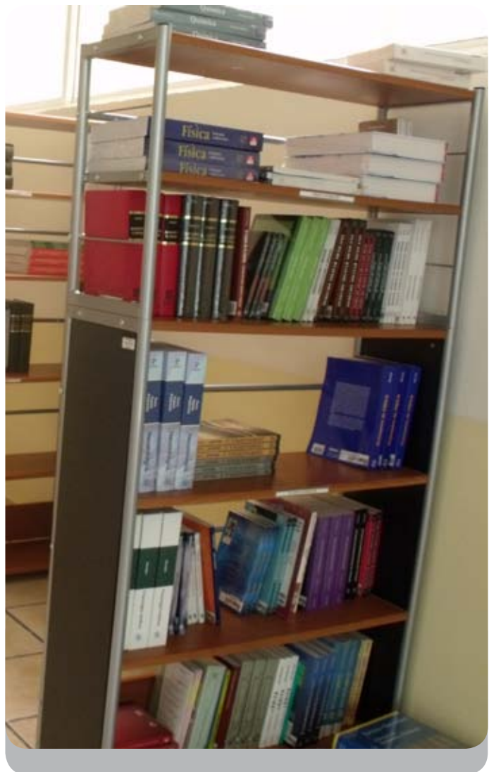
Fotografía número 3 y 4. Colectivo ARCION. Instalaciones de la Universidad Virtual CLEU. Biblioteca