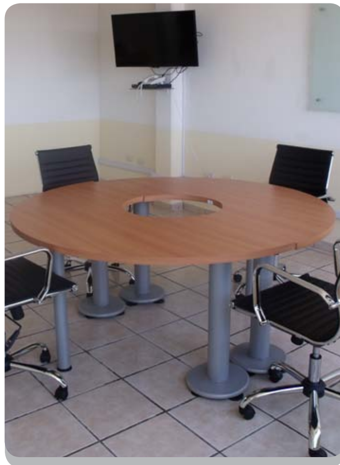
Fotografía número 1 Colectivo ARCIÓN. Instalaciones de la Universidad Virtual Sala de Videoconferencias

Universidad Virtual CLEU se contempla como una comunidad compuesta por académicos que buscan extender el servicio educativo a públicos nacionales e internacionales, enriquecer y ampliar el conocimiento de los alumnos, así como proporcionarles flexibilidad en tiempo y espacio, crear y difundir una nueva concepción de la enseñanza, fomentando el desarrollo de grupos multidisciplinarios y cooperativos.