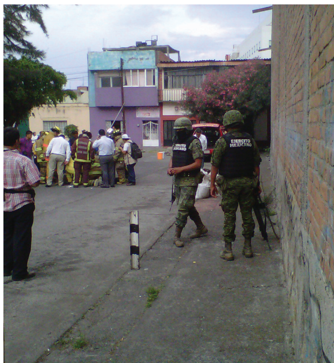
LOS ESPACIOS urbanos de algunas ciudades mexicanas se han visto inmersos en olas de violencia e inseguridad, lo que ha hecho necesaria la presencia de las fuerzas policiales.

‘Metodología’ puede ser examinada desde dos perspectivas: la metodología como el planteamiento lógico que tiene por objeto el estudio de los métodos; mientras que por otro lado, ‘metodología’ es entendida como aquel conjunto de aspectos operativos que deben de tenerse en cuenta durante el proceso de investigación.