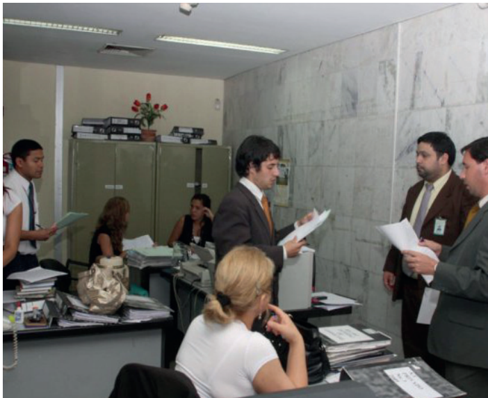
EL PAPEL del criminólogo-criminalista no se limita al esclarecimiento del delito; debe investigar y comparar entre sistemas, dando seguimiento a las reformas constitucionales.

miento de un hecho delictivo; como representante de las ciencias forenses demostrará la verdad de la comisión del delito, sustentada y fundamentada en métodos y técnicas de investigación al inspeccionar la escena del hallazgo y/o crimen, así como del estudio de los indicios encontrados.