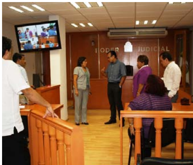
LOS CAMBIOS de este sistema se centran en cuatro aspectos: la organización, los personajes, la infraestructura y la tecnología.

que intervienen conocen el proceso en su totalidad. Con la implementación del nuevo sistema penal se protegen las garantías individuales y derechos humanos que la misma Constitución consagra, brindando seguridad jurídica a las personas.