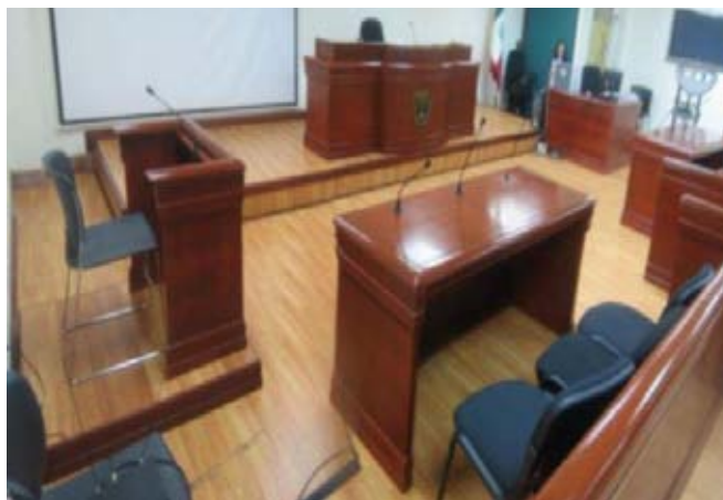
VIII JUZGADOS de juicio oral Chihuahua.