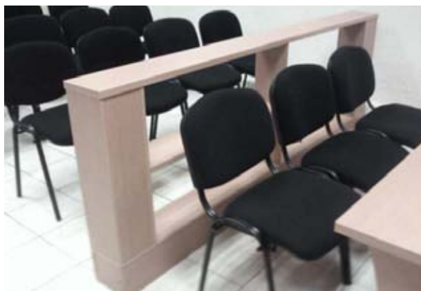
VII JUZGADOS de juicio oral. Oaxaca, Oaxaca.