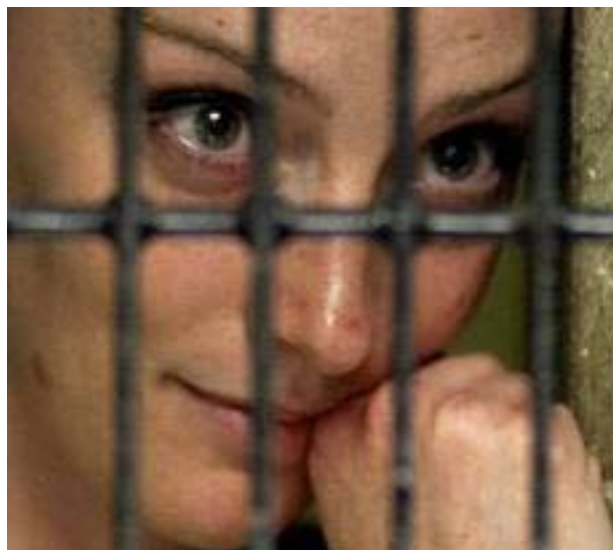
FLORENCE Cassez fue liberada porque su proceso penal estuvo "viciado". Se pretende eliminar este tipo de casos con los juicios orales.

Código Penal Federal: ser menor de 18 años y mayor de 14; padecer anomalías o alteraciones psíquicas; haber cometido el delito bajo intoxicación (bebidas alcohólicas, drogas tóxicas, estupefacientes, sustancias psicotrópicas u otra que produzcan efectos análogos); por sufrir de alteraciones de la percepción y de la conciencia de la realidad desde el nacimiento o de la infancia. Por lo tanto, la sala está obligada a contar con sistema de video-grabación de circuito cerrado, micrófonos, área para el público, considerando únicamente a la familia (mínimo de seis personas a un máximo de diez), no existe área de prensa, no es abierta al público, cuenta con los accesos y espacios específicos de una sala oral.