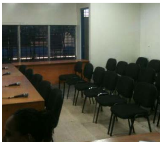
VIII JUZGADOS de juicio oral Chihuahua.