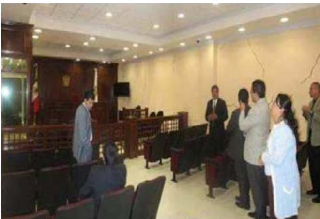
VI SALAS de juicio oral. Toluca, Edo. de México.