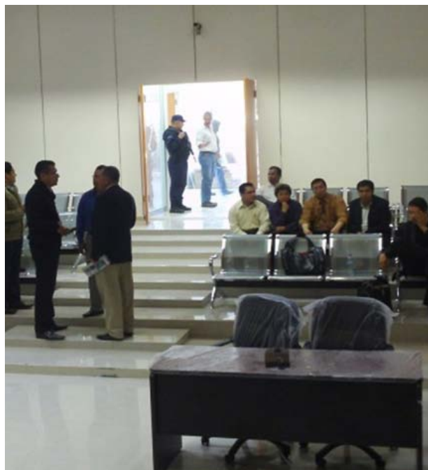
CON ESTAS nuevas instalaciones se pretende combatir la corrupción y procurar la transparencia en el proceso, promoviendo la igualdad entre los poblanos, por lo que se parte de los puntos foráneos y para llegar a la capital.

Todos estos puntos de muestran las siguientes imágenes.