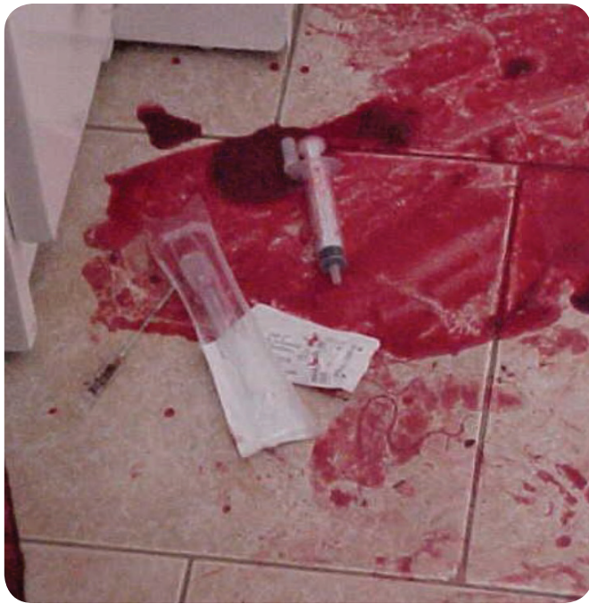
EN LA IMAGEN se aprecian los materiales que los paramédicos dejaron en el lugar. También se observan las manchas de sangre que fueron pisadas por personal policial.

El lugar del hecho citado anteriormente fue alterado por los servicios de emergencia, ¿qué significa esto?, que vinieron los paramédicos y no guardaron las normas de preservación; tiraron jeringas, tiraron gasas empapadas de sangre, que tal vez no está mal, considerando que fueron a salvar a una persona que estaba viva, aunque no lograron salvarla. ¿Pero qué ocurre?, el criminalista llega al lugar de los hechos y se encuentra un verdadero espectáculo. ¿Qué nos puede llegar a cambiar?, la metodología de trabajar y las hipótesis que después nos llegaron al lugar.