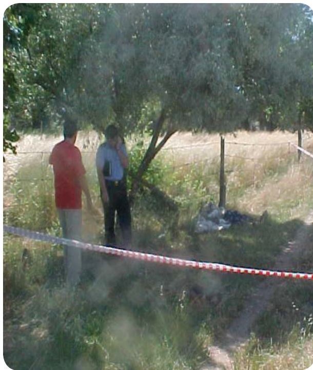
EN LA IMAGEN se se ejemplifica el descuido de distancia de preservación del lugar en una zona rural.

Por otra parte, muy pocos manuales sobre criminalística tratan el tema de las distancias de protección del lugar del hecho. Es decir, la mayoría de los indicios pueden estar fuera de la preservación que se hizo inicialmente; en algunos casos hemos preservado el lugar unos cincuenta metros y después encontramos indicios a cien, o hemos preservado a trescientos y encontramos a mil. Cuando la preservación del lugar no tiene una distancia considerable existen errores y se dejan fuera ciertas situaciones y elementos que podemos recolectar. También cabe la posibilidad de deterioro de indicios, cuando en el mejor de los casos no se han perdido. En mi experiencia, en lugares urbanos la distancia recomendada es de cincuenta metros, mientras que en zonas rurales es de trescientos metros. ¿Es posible extender estas distancias?, sí y sobre todo cuando surjan nuevos elementos.