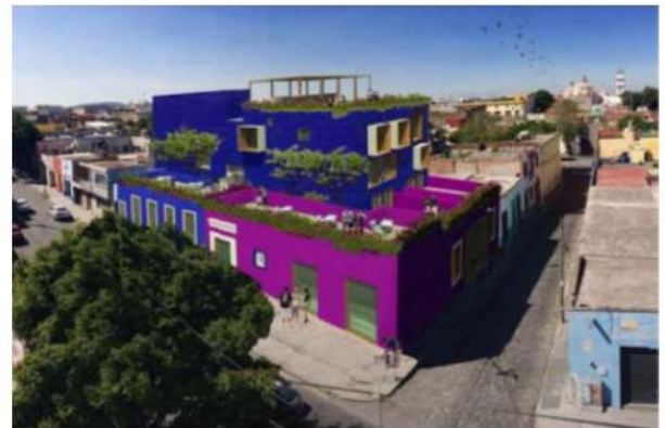
IMAGEN 7 Representación artística del proyecto. Capilla Vallejo Arquitectos. 2016.