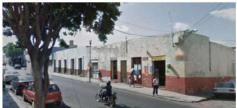
IMAGEN 1 Vista exterior de las casonas Av. Don Juan de Palafox y Mendoza 1201 y 1203 previa a su turistificación. Abril 2015.