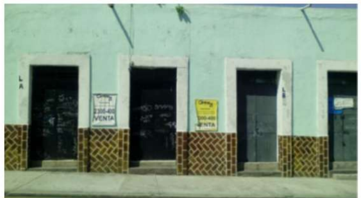
IMAGEN 2 La casona 1201 puesta a la venta. 2016.