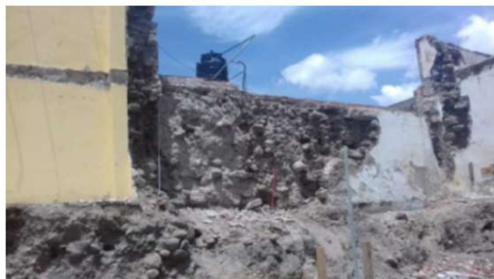
IMAGEN 5 Detalle del desmantelamiento del muro de colindancia la casona 1201. 2016.