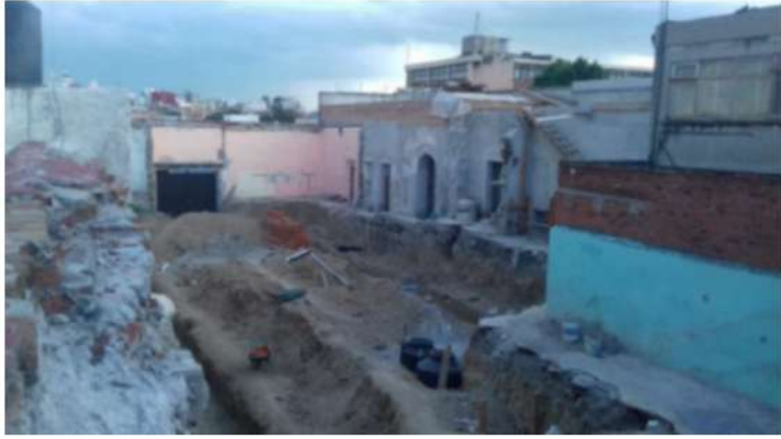
IMAGEN 3 Vista poniente de la limpieza y excavación del terreno que ocupaban las casonas 1201 y 1203 de la Av. Don Juan de Palafox y Mendoza. 2016.