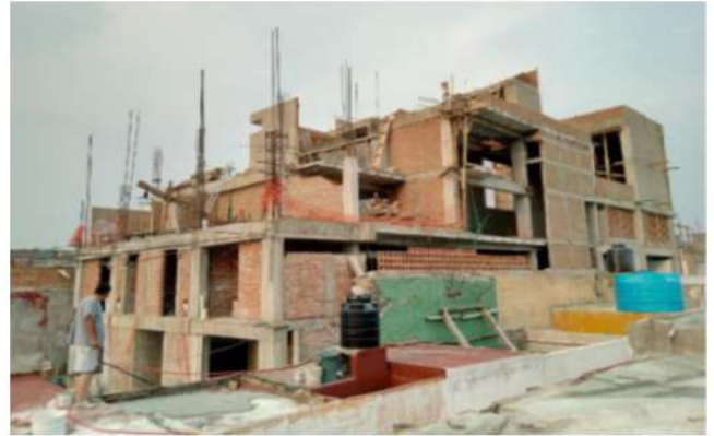
IMAGEN 6 Avances de la construcción a mediados de 2020. 2020..