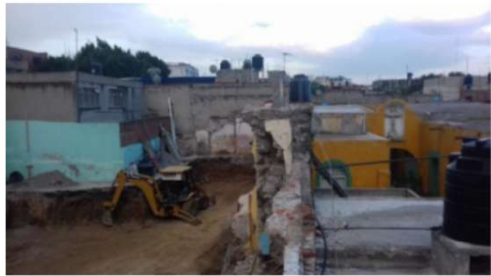
IMAGEN 4 Vista de la colindancia entre los edificios demolidos a la izquierda y la preservación de la casona 104 a la derecha. 2016.